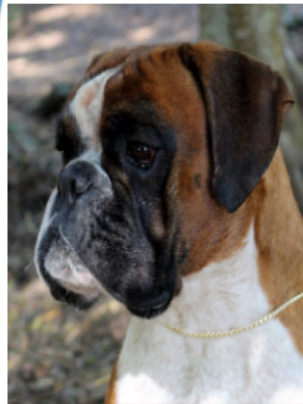
Kasanova de Porto Village - BOBBCP/18

Exposição com CAC-QC Pontuável para o campeonato Ibérico